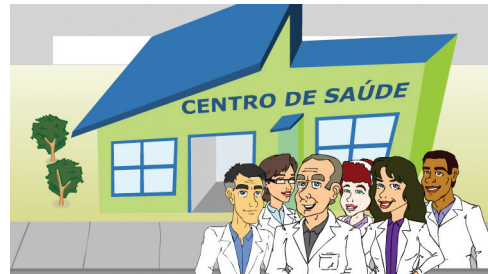
Imagem 2 – Composição mínima da equipe de saúde

3 – Equipe multiprofissional: a composição mínima da equipe é conformada por um médico, um enfermeiro, um cirurgião dentista, um auxiliar de enfermagem, um auxiliar de consultório dentário e de quatro a seis agentes comunitários de saúde.